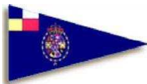
Real Club Nautico de Barcelona